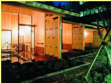
内風呂も露天も一度に貸切できる